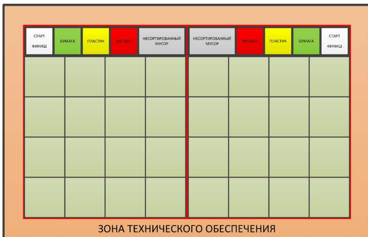
Схема поля при проведении заездов на этапе «Сбор мусора»

8.9. В состав полигона входит комната оператора, который осуществляет управление Роботом в случае использования режима телеуправления (см. раздел 9)